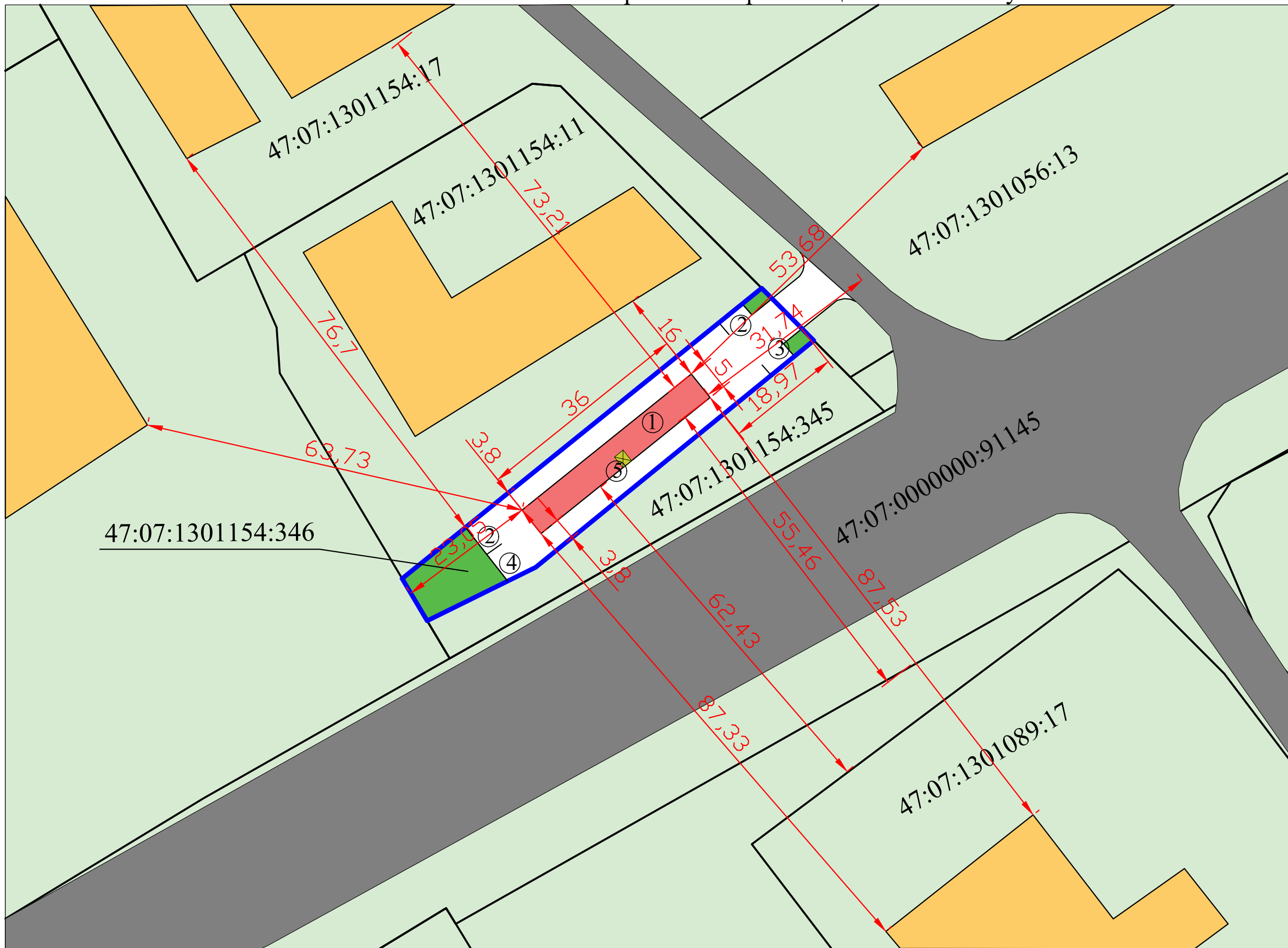
Схема планировочной организации земельного участка